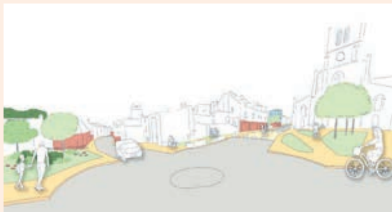
Suggestion d'aménagement de la place Saint-Martin

Les structures de santé seraient regroupées dans l'actuelle mairie et l'ancienne poste, entourée d'un plateau pour piétons et cyclistes afin de les relier avec la pharmacie. Le club de l'Amitié serait déplacé au sein du complexe sportif avec la création d'un espace de jeux favorisant