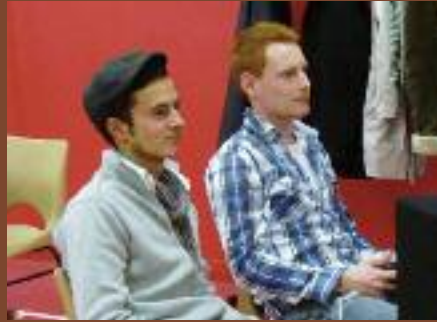
Cette année, les membres d'Ô Tour du globe proposaient des jeux vidéos : danse, foot, bowling... Félicitations pour leur investissement.