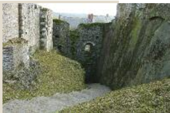
Le fossé après nettoyage