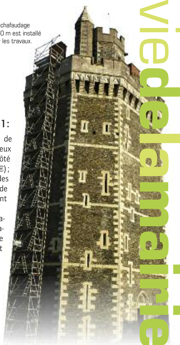
Remplacement des pierres des meurtrières

Un échafaudage de 40 m est installé pour les travaux.