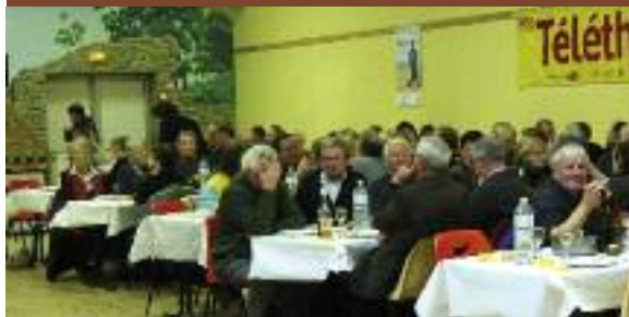
Plus de cent-cinquante convives sont venus déguster le désormais traditionnel cochon enterré. Au cours du repas a eu lieu le tirage de la bourriche sous l'égide de l'USO. Les résultats sont sur le site du club.