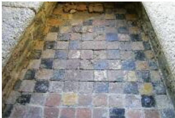
Dans le donjon, les tomettes d'origine se descellent