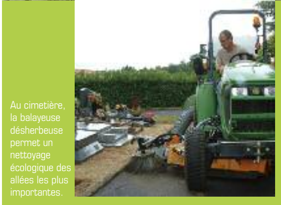
Au cimetière, la balayeuse désherbeuse permet un nettoyage écologique des allées les plus importantes.

peu naturel. Or, le cimetière, fortement en pente et en connexion directe avec Loire, est une zone à risque. Les objectifs d'entretien « sans mauvaise herbe » et l'impossibilité d'utiliser des pesticides de synthèse conduisent la commune à trouver de nouvelles solutions :