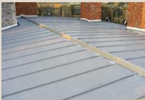
Donjon : ancienne et nouvelle couverture