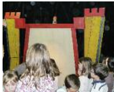
Régulièrement les jeunes enfants sont accueillis à la bibliothèque.