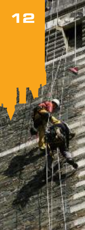
Installation du feuillard du paratonnerre