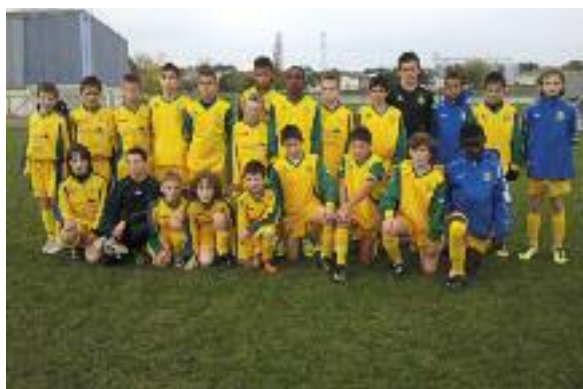
Catégorie U13 Contre le FC Nantes A en Coupe Nationale

Chaque catégorie des jeunes licenciés de l'USO a la chance d'être encadrée au minimum par un adulte diplômé.