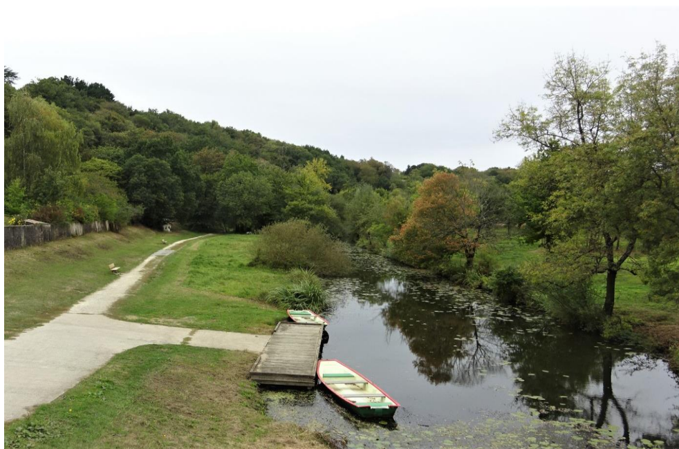
La Vallée du Hâvre

Schéma Directeur d'Assainissement Pluvial– SDAP et PLU